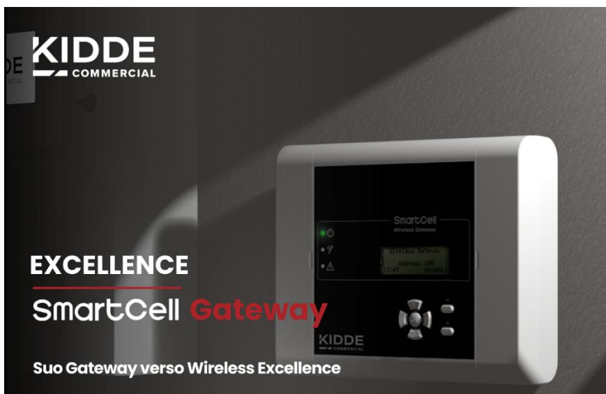
Immagine 2: EXCELLENCE SmartCell Gateway è pensato per accompagnare la crescita e l'evoluzione dell'infrastruttura di sicurezza dell'edificio nel tempo.

Immagine 1: EXCELLENCE SmartCell Gateway è una nuova e potente interfaccia dell'ecosistema di rivelazione incendi EXCELLENCE.